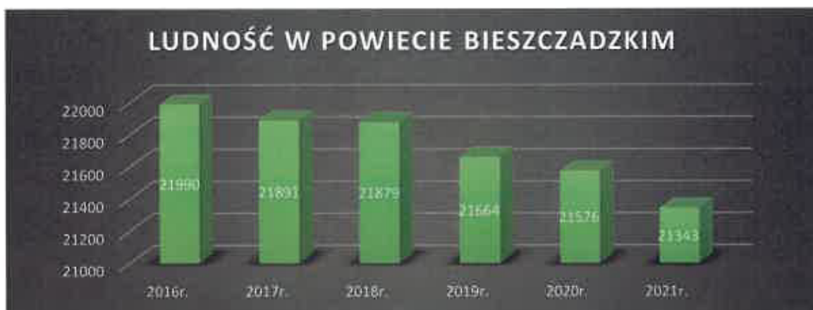
Liczba ludności w powiecie bieszczadzkim w latach 2016-2021 (źródło: GUS)

Dzięki staraniom władz samorządowych, systematycznie poprawia się stan infrastruktury. Atutem powiatu jest międzynarodowe przejście graniczne w Krościenku, które umożliwia przejazd na Ukrainę, Węgry i do krajów bałkańskich. Pomyślnie układa się współpraca transgraniczna z Ukrainą.