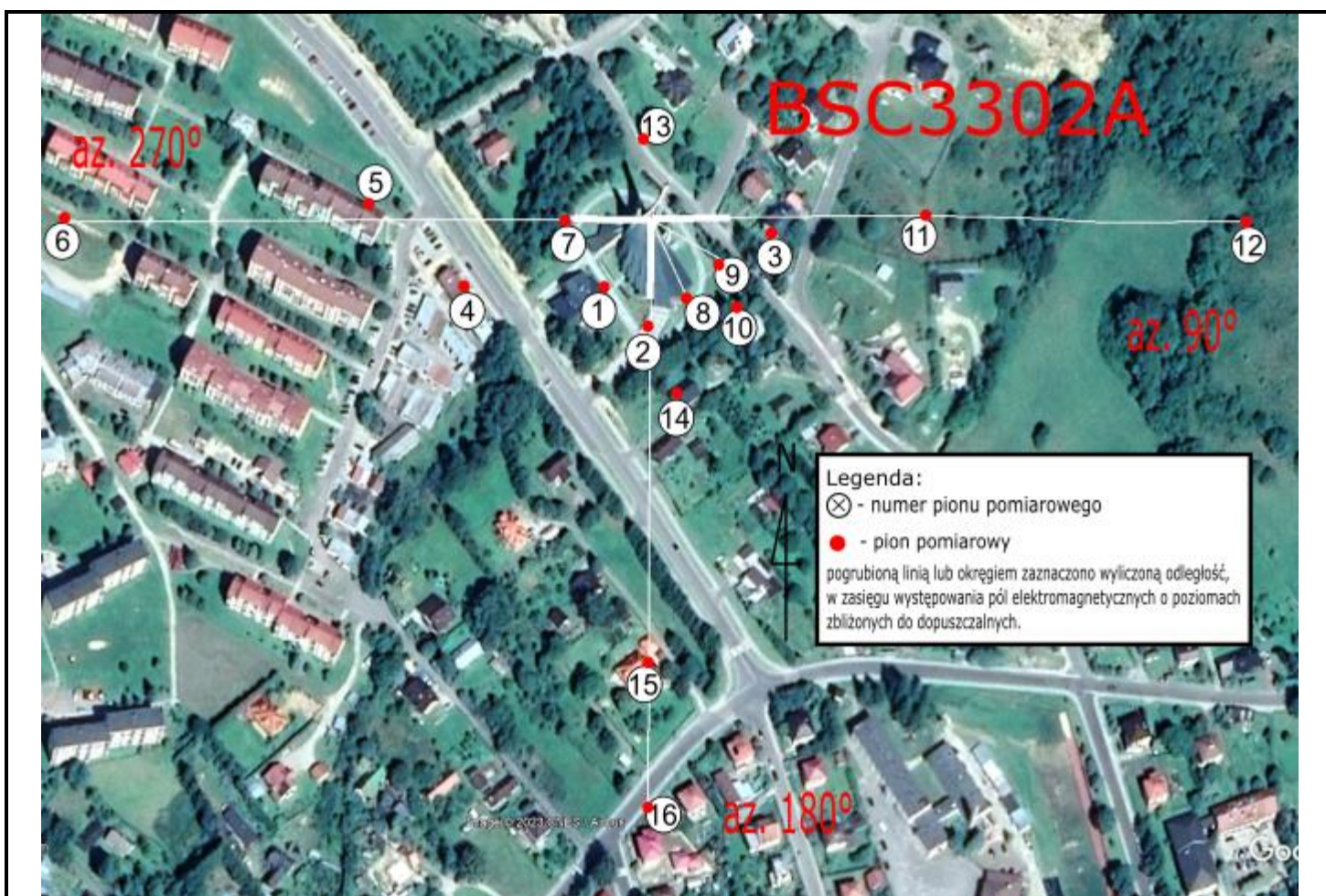
Zdjęcie satelitarne: Image © 2023 Google

Załącznik nr 1 – Rysunek poglądowy terenu, rozmieszczenie pionów pomiarowych na terenie wokół stacji