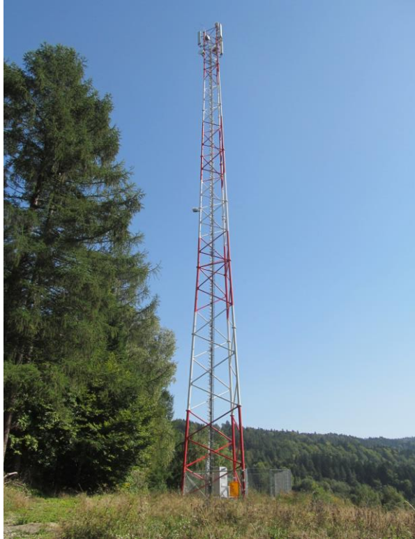
Zaf. nr 1: Widok ogólny instalacji radiokomunikacyjnej.