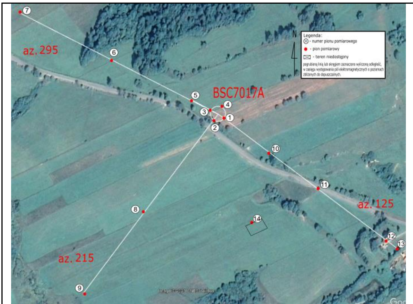
Zdjęcie satelitarne: Image © 2023 Google

Załącznik nr 1 – Rysunek poglądowy terenu, rozmieszczenie pionów pomiarowych na terenie wokół stacji