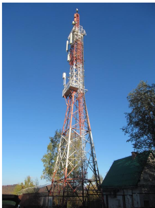
Zał. nr 1: Widok ogólny instalacji radiokomunikacyjnej.