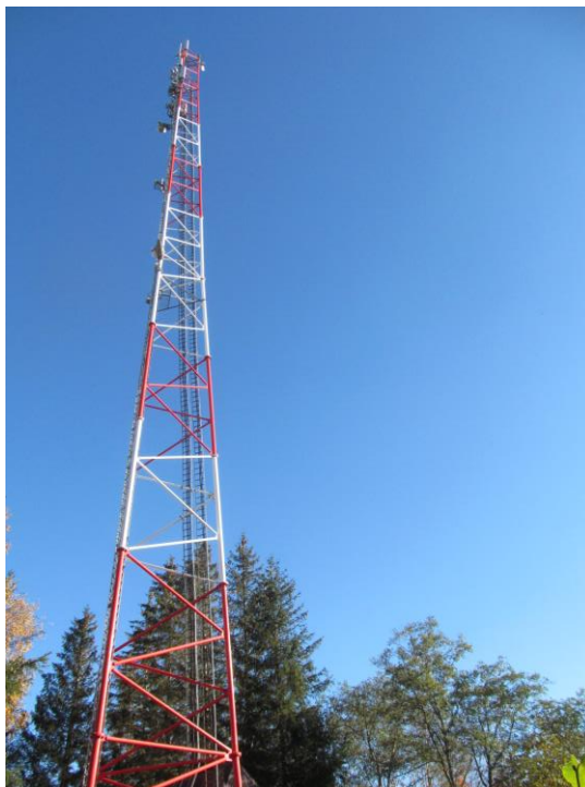
Zał. nr 1: Widok ogólny instalacji radiokomunikacyjnej.

Koniec sprawozdania. Sprawozdanie zawiera dodatkowo załączniki nr 1 i 2.