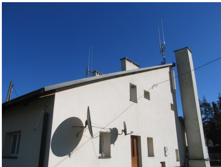
Zaf. nr 1: Widok ogólny instalacji radiokomunikacyjnej.