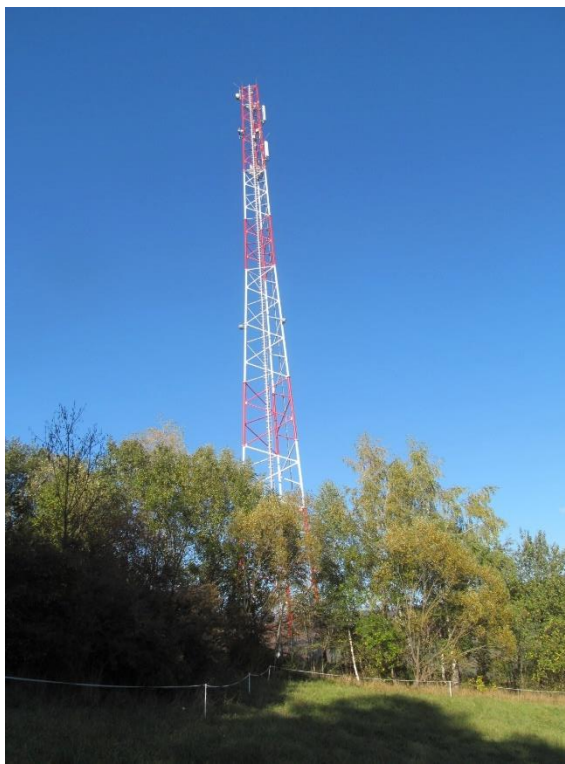
Zał. nr 1: Widok ogólny instalacji radiokomunikacyjnej.