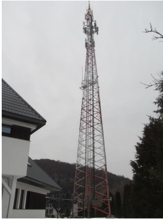
Załącznik nr 1: Widok ogólny instalacji radiokomunikacyjnej.

Koniec sprawozdania. Sprawozdanie zawiera dodatkowo załączniki nr 1 i 2.